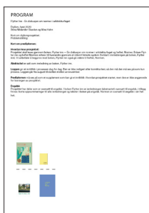
Program Størrelse: A4

Prosjektet har deler som er oversatt til engelsk. I boken, Flytter inn, er innledningen (abstractet) oversatt til engelsk, i tillegg finnes korte oppsummeringer til alle kapitler og tekster i boken på engelsk. Normen er oversatt til engelsk i sin helhet.