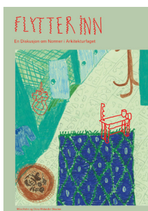
Flytter inn — En diskusjon om normer i arkitekturfaget. Størrelse: A4