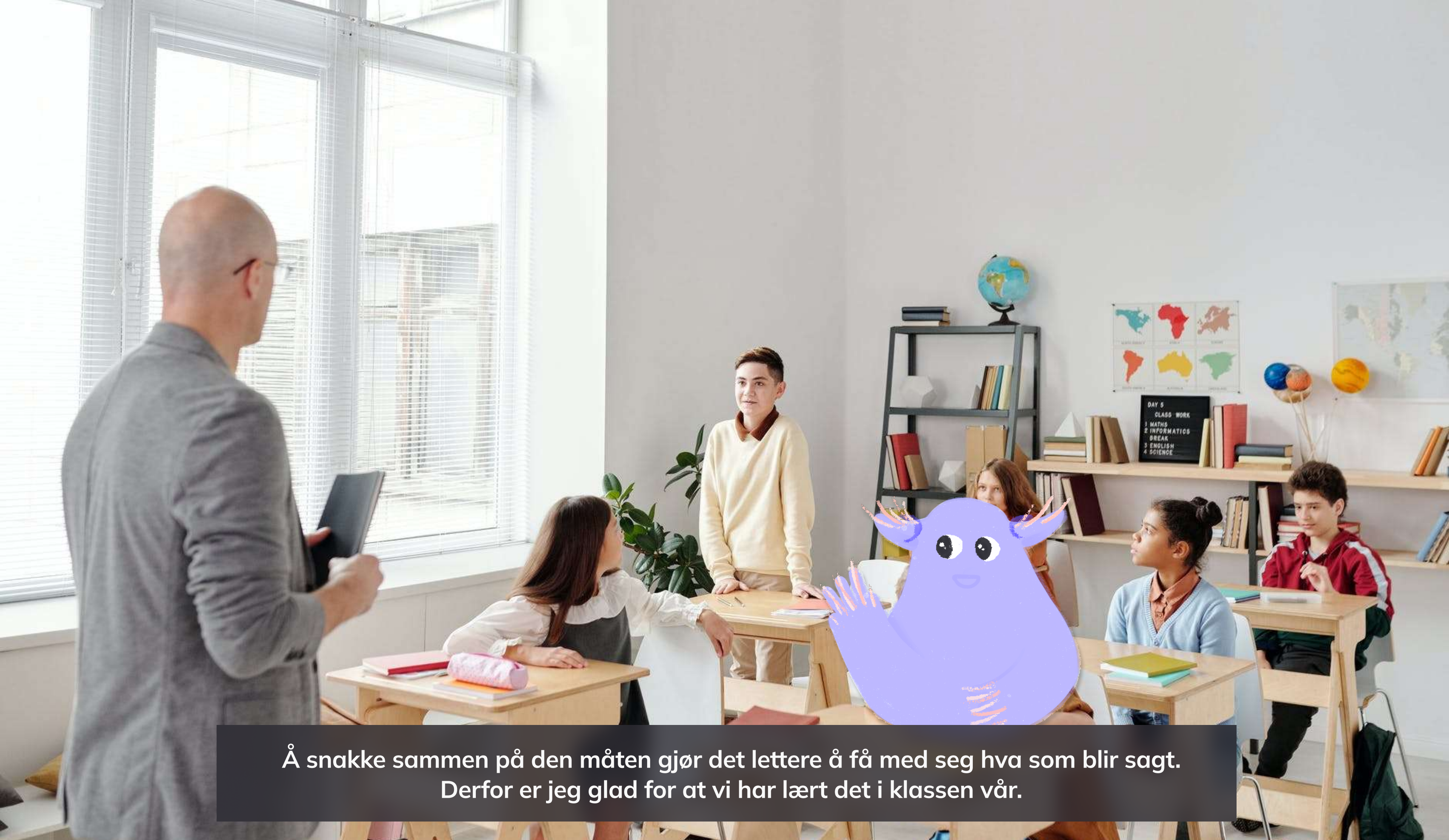
Å snakke sammen på den måten gjør det lettere å få med seg hva som blir sagt. Derfor er jeg glad for at vi har lært det i klassen vår.