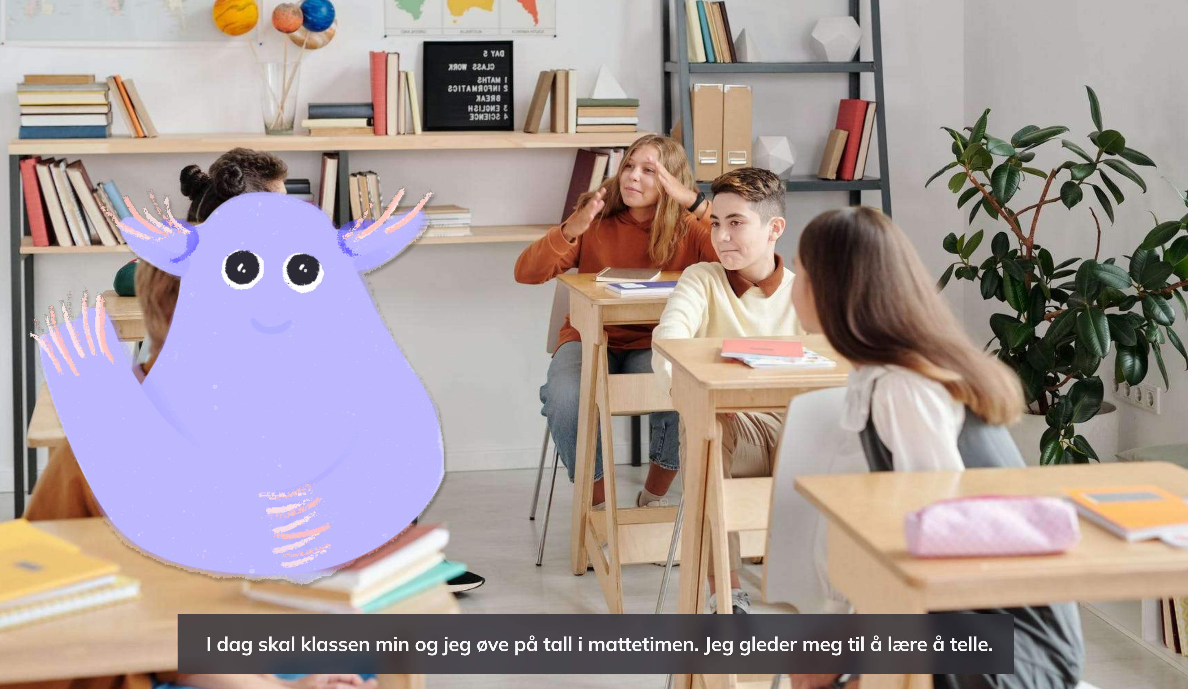
I dag skal klassen min og jeg øve på tall i mattetimen. Jeg gleder meg til å lære å telle.