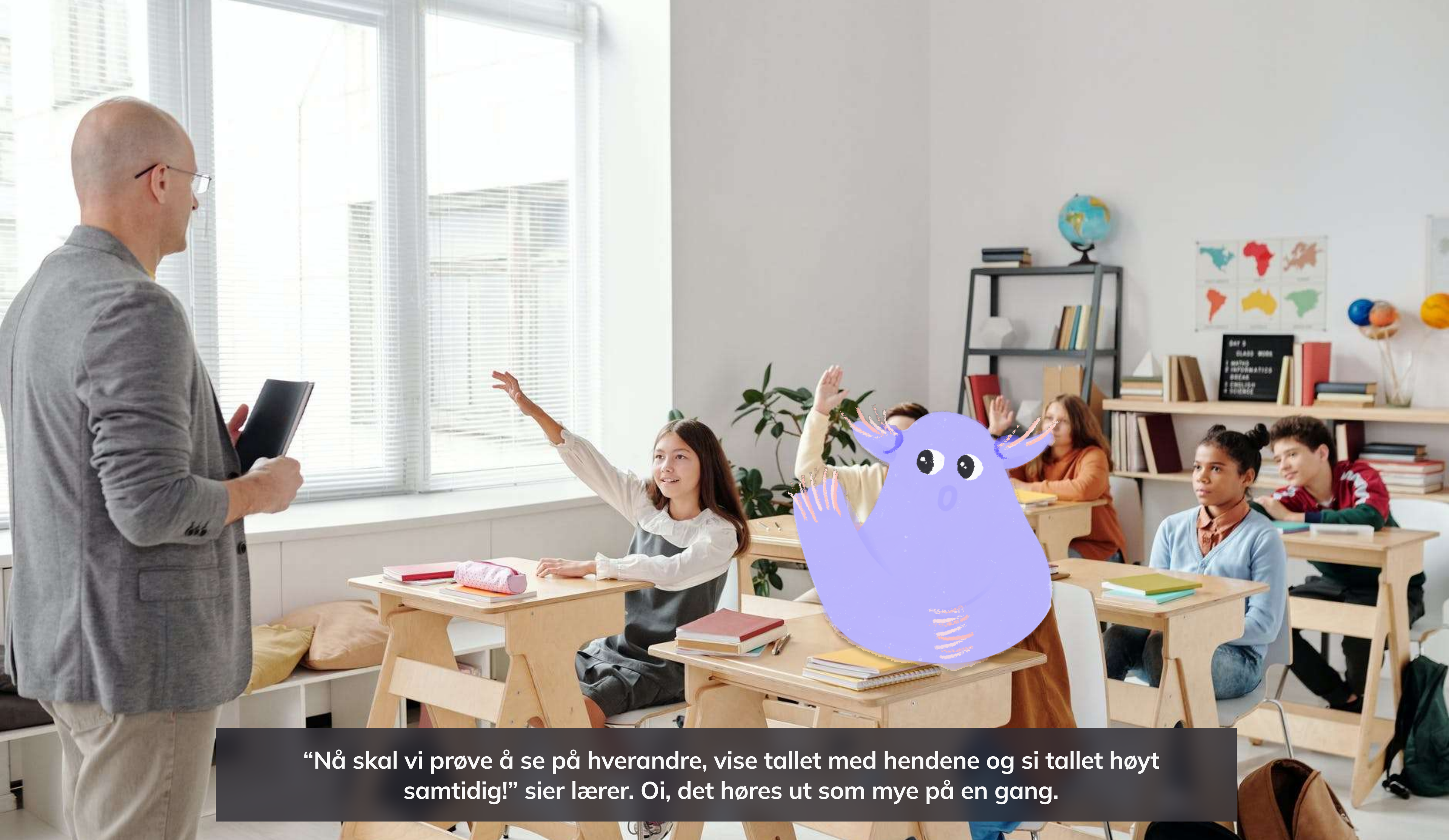
“Nå skal vi prøve å se på hverandre, vise tallet med hendene og si tallet høyt samtidig!” sier lærer. Oi, det høres ut som mye på en gang.